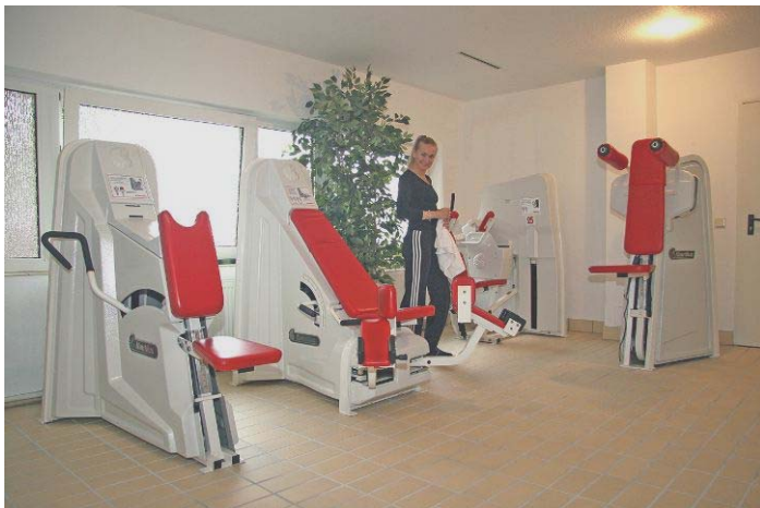
Entspannen Sie im Wellnessbereich