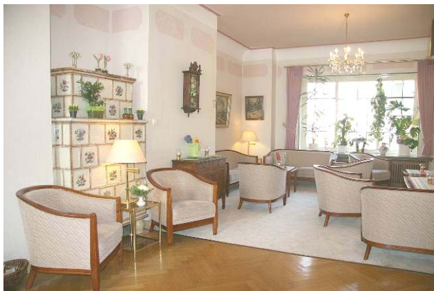
Die gemütliche Hotel-Lobby