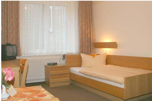
Einblick in unsere komfortablen Zimmervarianten