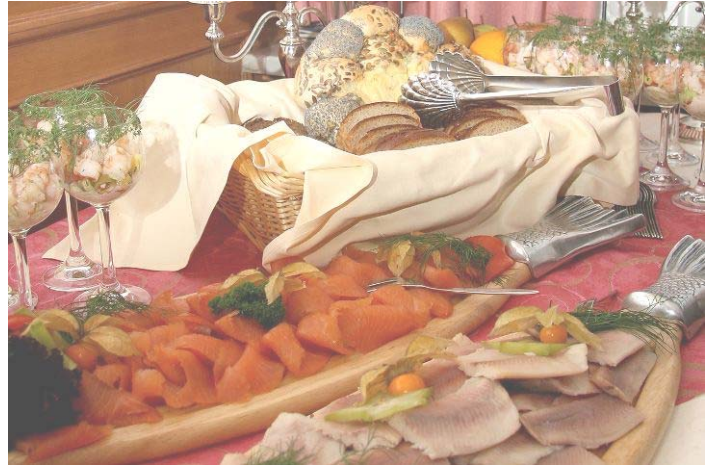
Unsere gastronomische Verwöhnase