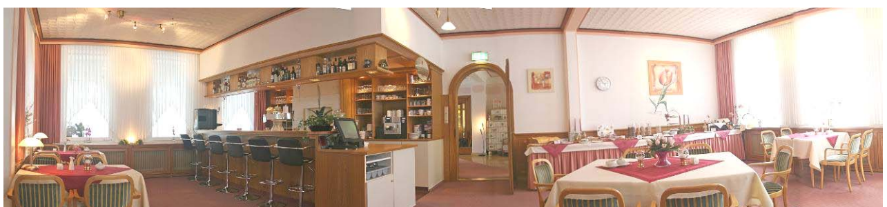
Buffet- und Barbereich